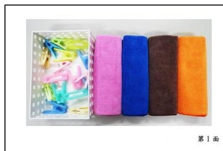
第 1 面