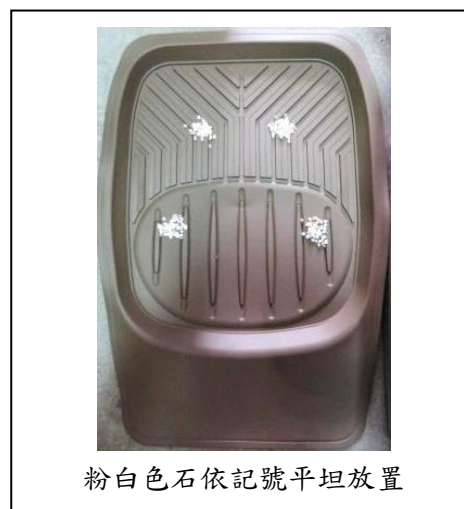
粉白色石依記號平坦放置