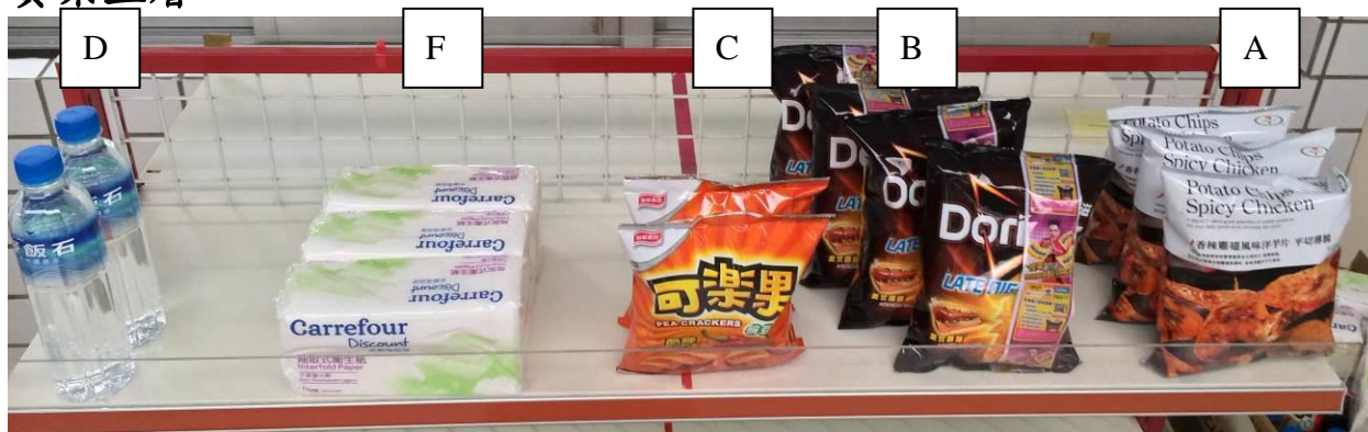
貨架下層(用擦擦筆畫對角線)