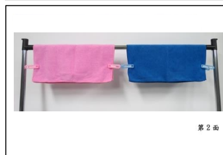
第 2 面